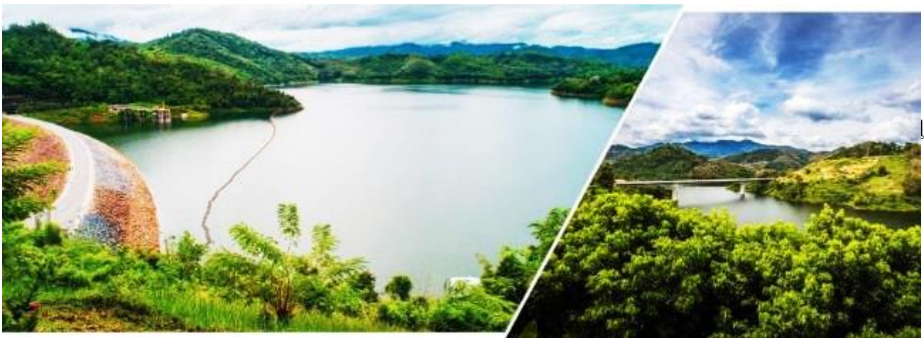
ในหมอก คอ

☞ สู่ เบตง อำเภอปลายด้ามขวาน ตั้งอยู่ได้สุดของประเทศไทย เต็มไปด้วยแหล่งท่องเที่ยวที่น่าสนใจ ทั้งธรรมชาติและวัฒนธรรม ก่อนเข้าสู่เขตเมืองเบตง และ จุดชมวิวสะพานข้ามอ่างเก็บน้ำเขื่อนบางลาง หรือสะพานโต๊ะกูแซ อีกหนึ่งสถานที่พักผ่อนและชมวิวยิวทัศน์ภูเขาที่โอบล้อมเขื่อนบางลาง ให้ท่านได้ชมวิวดูอากาศสดชื่น ถ่ายรูปตามอัธยาศัย